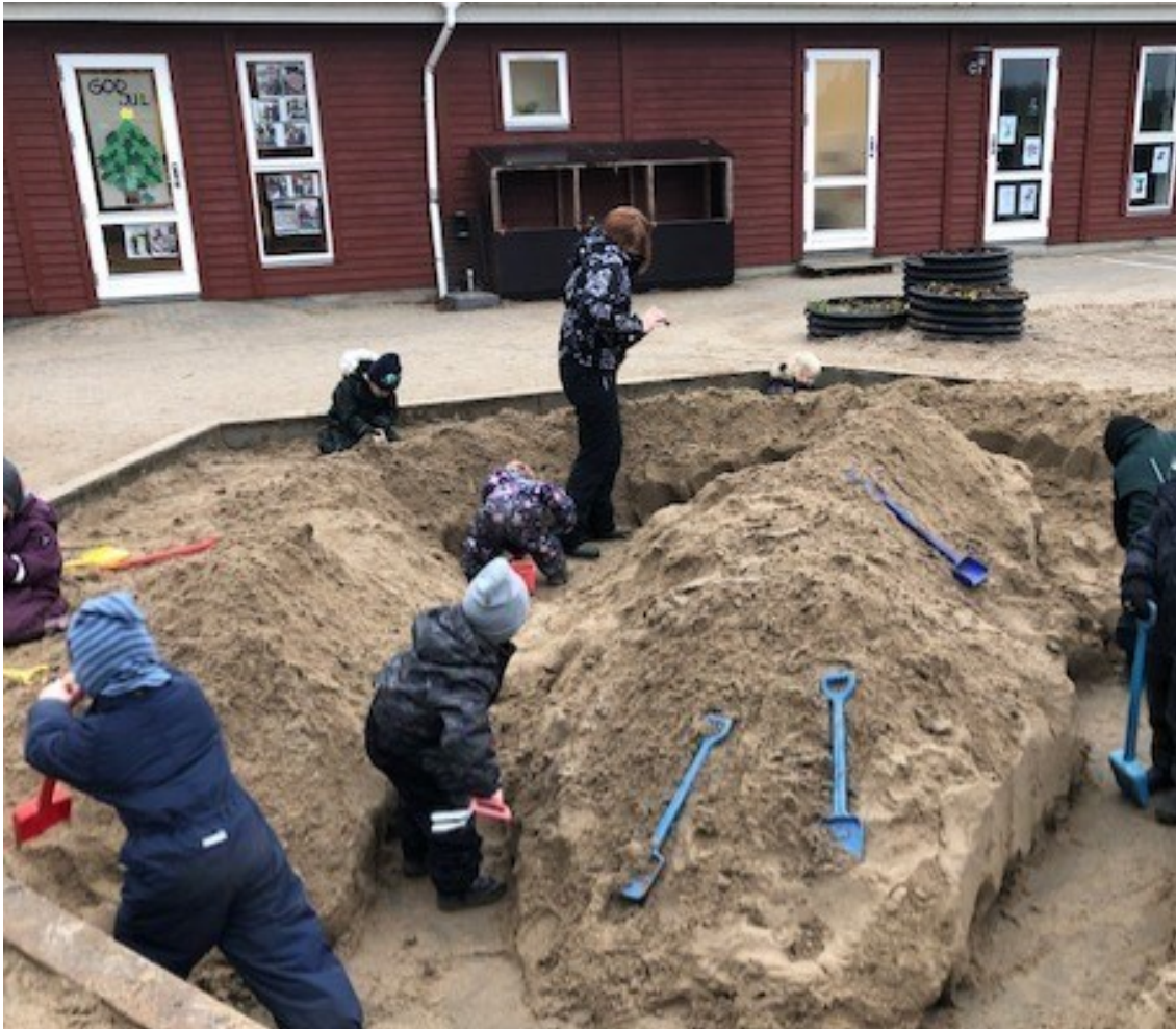
Billede kæmpe graveprojekt i sandkassen