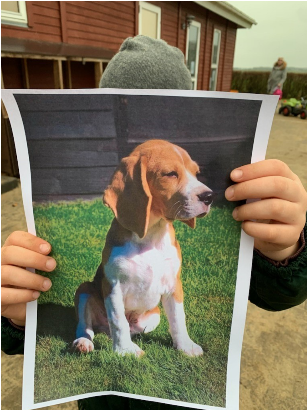
Billede af en super glad pige