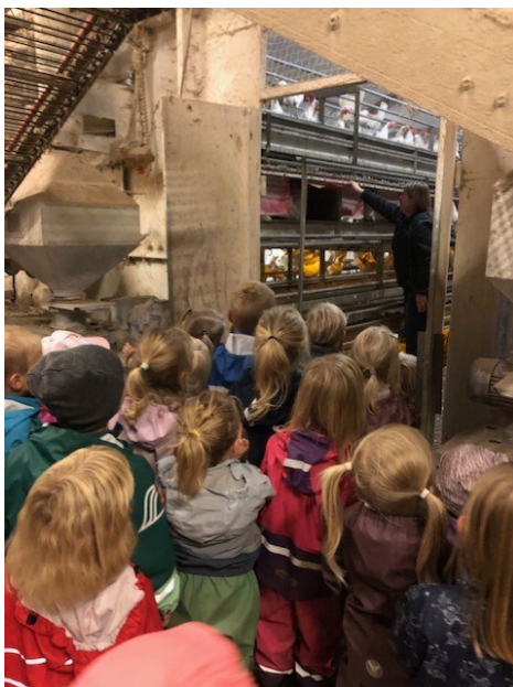
Billede fra Hønseriet

Vi har meget stor opbakning fra vores lokalsamfund, bl.a. i form af hyggegruppen. Det er en gruppe af pensionister, der bl.a. laver mad til vores arbejdsdage og står for at forholde vores julefrokost i kulturhuset.