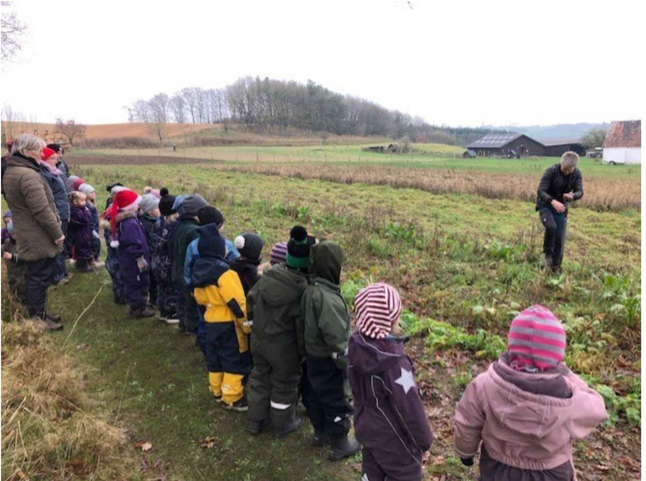
Billede fra Boldrup museum

Vi var her i efteråret på hønseriet og så alle de mange høns. Vi lærte om, hvordan de lagde æg, og mødte de folk, der håndsorterer æggene efter størrelse. Samme uge fik vi æggemadder og pandekage