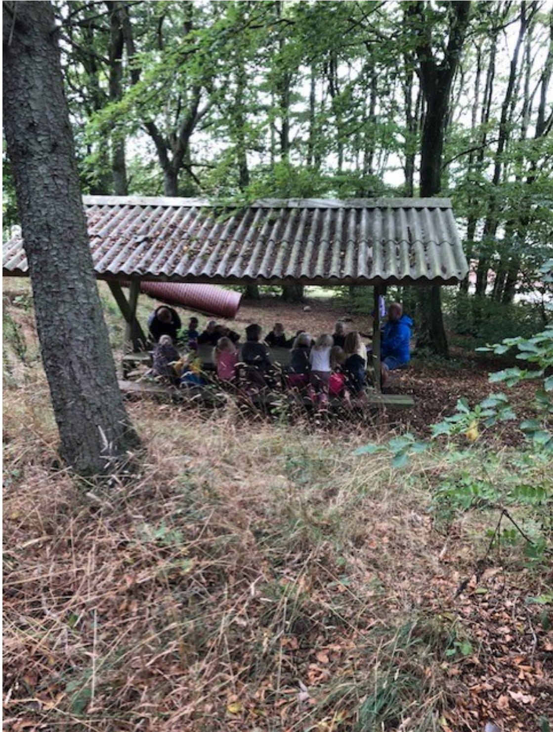
Billede fra vores skov