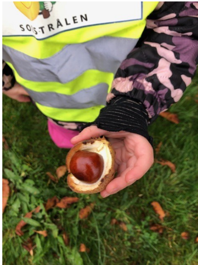
Kastanjetur med de store