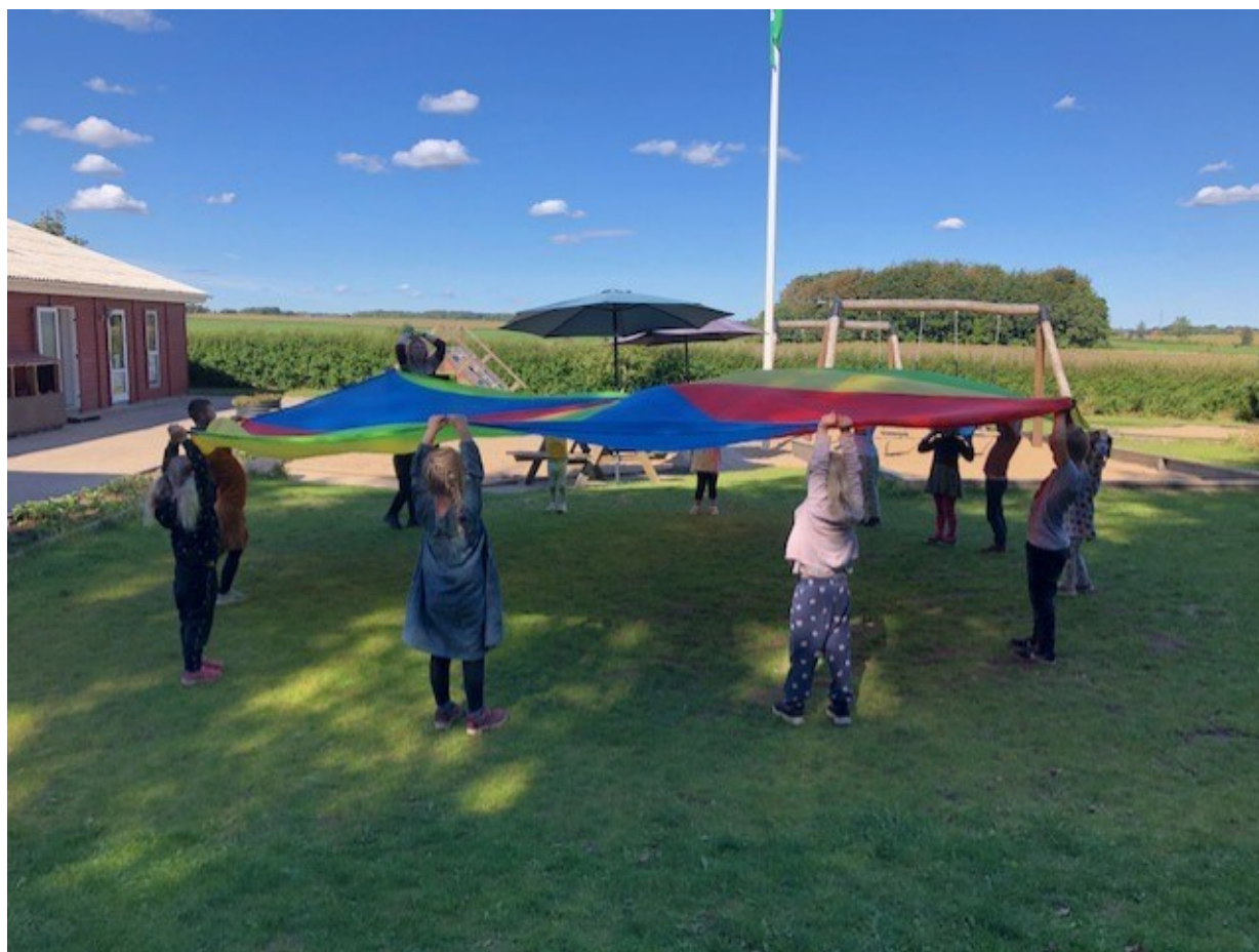
Billede fra legepladsen