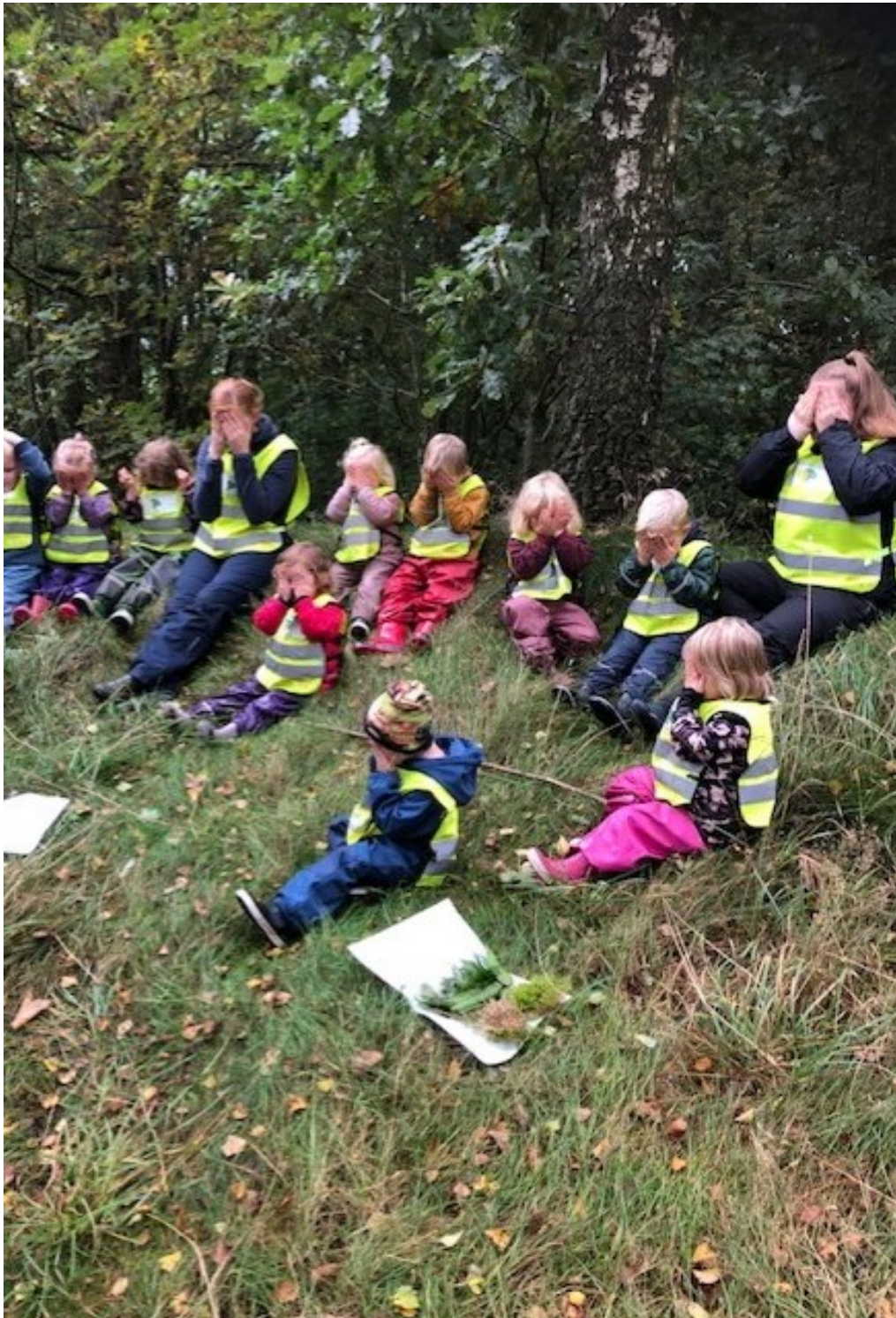
Billede fra Antongryde