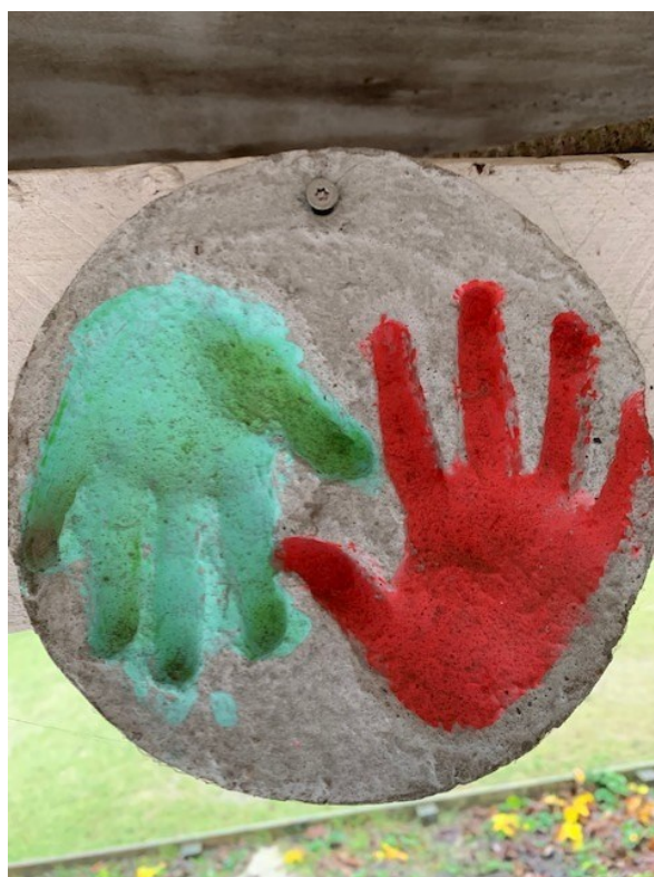
Billede fra venskabsugen

I venskabsugen var vores tema om, hvordan man kan være en god ven. Børnene fik fx på den første dag venskabsmakker. Deres første opgave var at aftegne og klippe deres hænder ud. De satte så et billede af sig selv på den udklippede hånd. På en stor opslagstavle hang venskabsmakkerne deres hænder med billeder op sammen. I løbet af ugen oplevede vi, at børnene øvede sig i at skabe nye venner på tværs af deres køn og alder. De store børn var gode til at hjælpe spillerne med de forskellige opgaver, fx til spisning af madpakker.