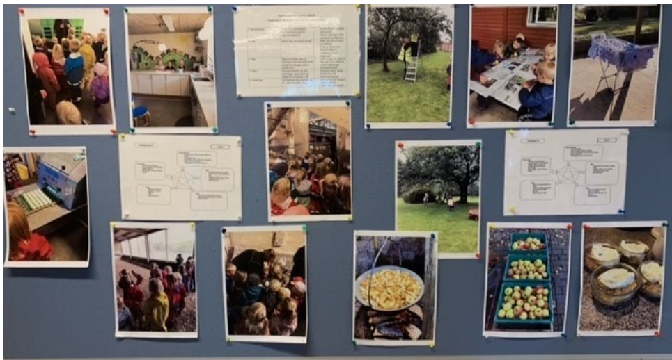
Billede fra vores opslagstavle