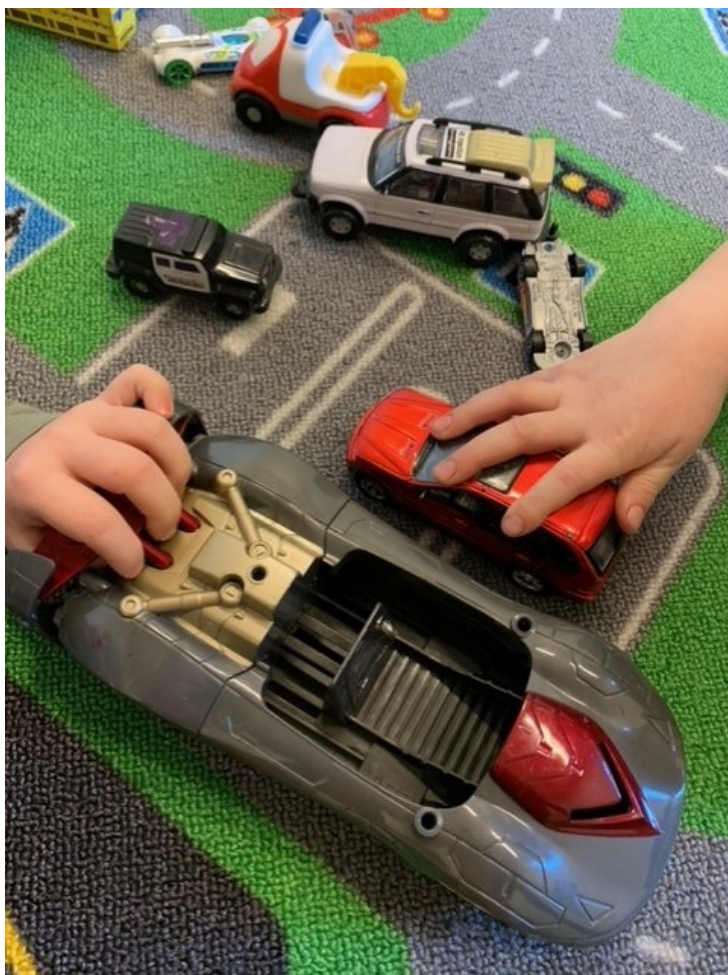
Billede af leg

Vi har to drenge, der har mødt hinanden i børnehaven og er blevet venner. Drengene spørger tit hinanden, om de skal lege hjemme ved hinanden. Her støtter vi op og fortæller forældrene, at de to drenge gerne vil have en legeaftale. På dagen, hvor de skal lege sammen efter børnehaven, glæder de sig og fortæller de andre børn, at de skal lege sammen. De andre børn spørger til, hvad de skal lege osv. Der kommer mange bud fra de andre børn på, hvad de skal lave sammen. Vi bliver enige om, at vi skal huske at spørge i morgen, om hvad de har lavet sammen.