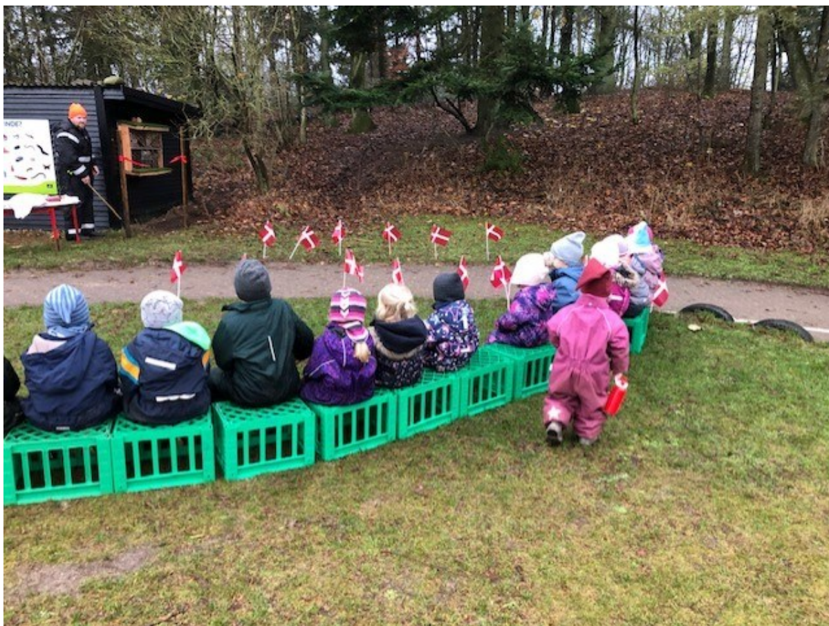
Billede fra indvielse af insekthotellet