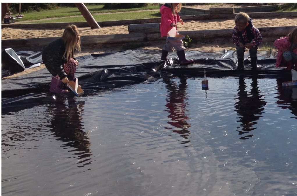
Billede fra sandkassen

Et af vores fokusområder er sproglig indlæring. Derfor bliver alle børnene sprogtestet ved 3 månedssamtale, og når de fylder 4, 5 og 6 år og lige op til skoleoverlevering. Nogle af vores børn er tosprogede og har sproglige vanskeligheder, hvor de følger et forløb hos en logopæd. Vi forsøger at gøre det til en positiv oplevelse for alle, når vores logopæd besøger børnehaven. De børn, som følger et forløb hos hende, har hver en mappe med de ting, som de arbejder med i forløbet. De fortæller og viser gerne deres mapper frem og fortæller, hvad de har øvet sig på eller lært.